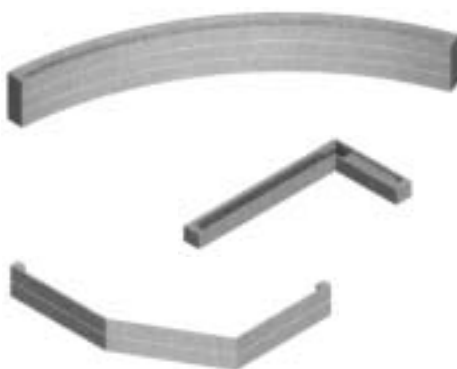
Конвекторы сложной формы